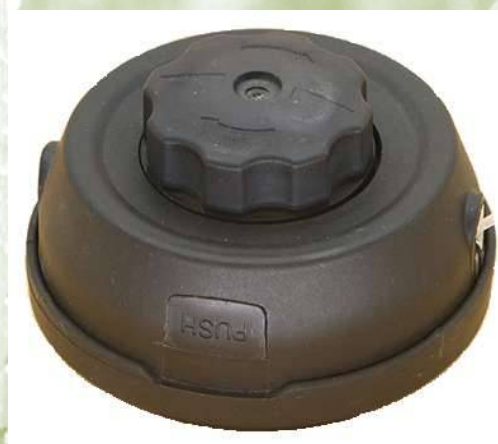
ZODIAKO plastic - semiprofi