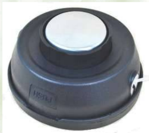
ZODIAKO metal - profi

Výmena lanka je záležitosťou niekoľkých sekúnd , nakoľko vďaka možnosti prevliecť lanko cez hlavu, netreba hlavu rozoberať. Jeden kus lanka, v dĺžke potrebnej pre obe strany, sa prevlečie cez hlavu a zároveň sa v nej na stred jeho dĺžky. Následným otáčaním cievky v smere hodinových ručičiek, sa namotá. Tým, že oba konce tvorí jedno lanko nemôže nastať, že by sa počas práce niektoré uvoľnilo. Pohodlné navíjanie lanka umožňujú vymeniteľné kovové priechodky, ktoré vďaka rádiusu predlžujú životnosť lanka - znižujú oter a nebezpečenstvo zlomenia lanka.